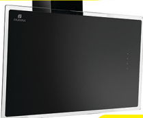
سفید F608 T