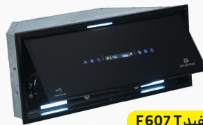
سفید F607 T