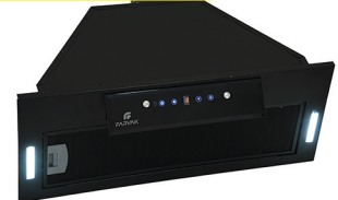
F609 M size:70 cm