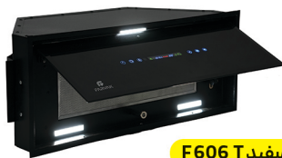
سفید F606 T